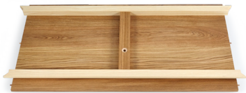
Bodenplatte (mit Innengewinde für Mittelfuß)