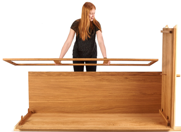
4. Innenrahmen auf die Lasche der Bodenplatte setzen.