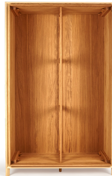
10. Schrank auf die Füße stellen. Mittelfuß dem Boden anpassen und festschrauben.