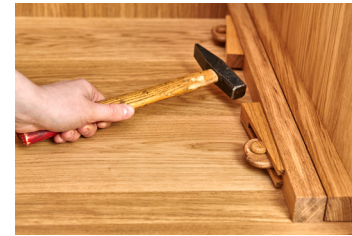
9. Die restlichen Spannkeile montieren.