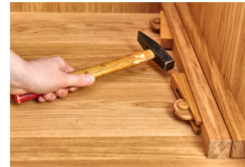
6. Deckplatte, Bodenplatte, Seitenwand und Innenrahmen miteinander verbinden: zuerst Holzdübel durch die Lasche stecken, dann Spannkeil auf die Lasche stecken und gefühlvoll „auf Zug“ festklopfen.