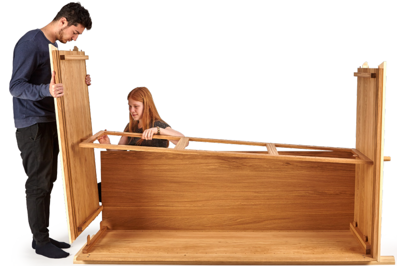
5. Deckplatte auf die Seitenwand setzen, gleichzeitig die Lasche der Deckplatte durch den Schlitz des Innenrahmens führen.