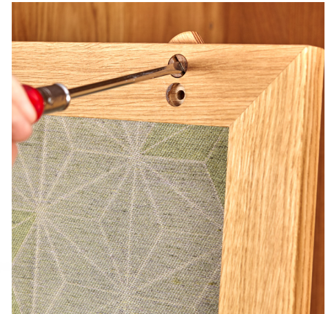
11. Die oberen Laufräder der Türen mit einem Schraubenzieher so weit verdrehen, bis sie vollständig im Rahmen verschwinden.