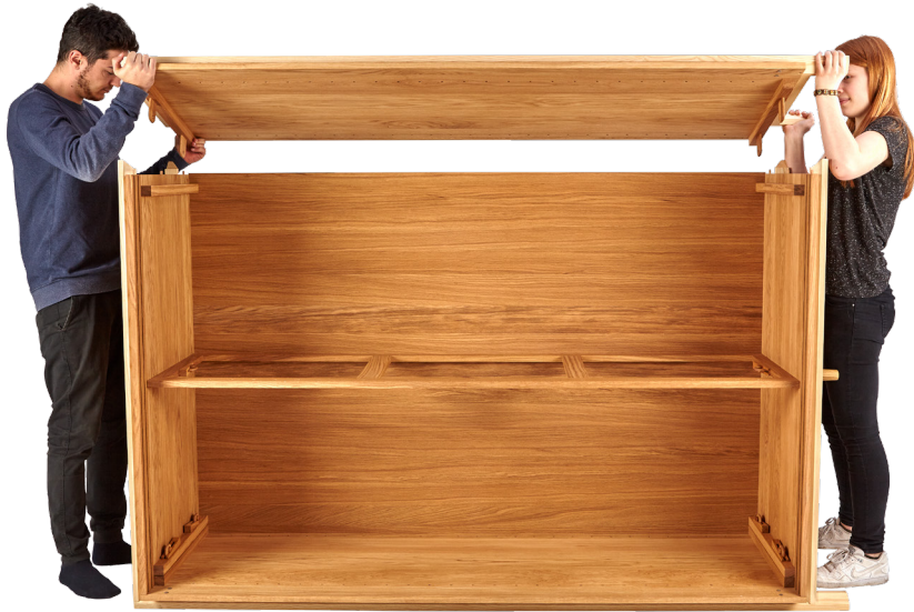
8. Seitenwand montieren: deren Laschen durch die Schlitz von Boden- und Deckplatte führen.