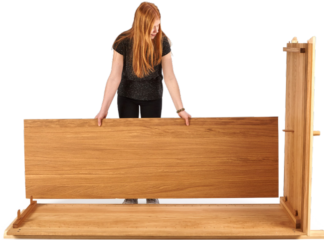
3. Erste Rückwand in die Nuten der Seitenwand und Bodenplatte einpassen, satt andrücken.