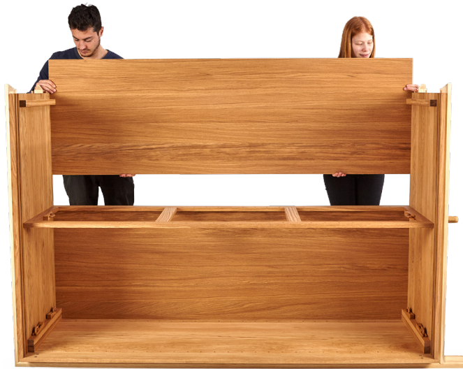
7. Zweite Rückwand gleichmäßig (!) in die Nuten von Deck- und Bodenplatte einfädeln.